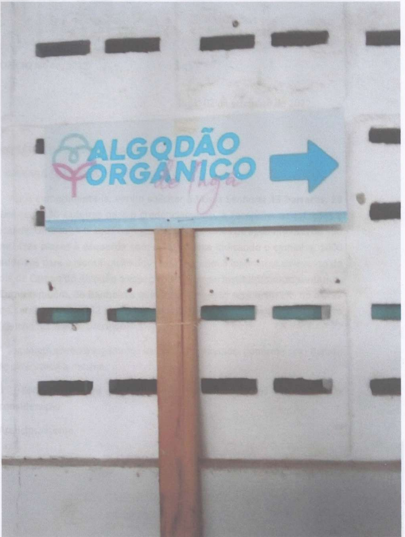
Secretaria adjunta de Agricultura, de Pesca e Agricultura Familiar