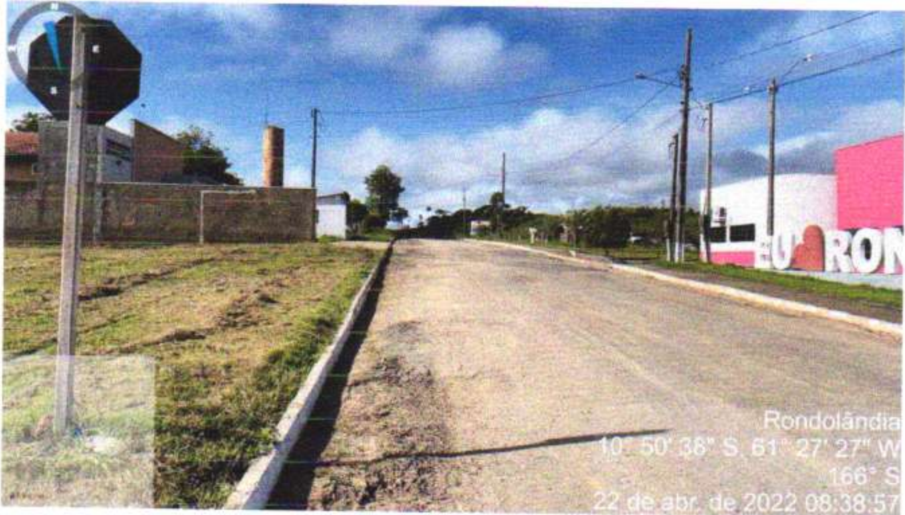
11 – AV. JOANA ALVES DE OLIVEIRA TRECHO (AV DOM BOSCO / RUA EDVALDO RODRIGUES)