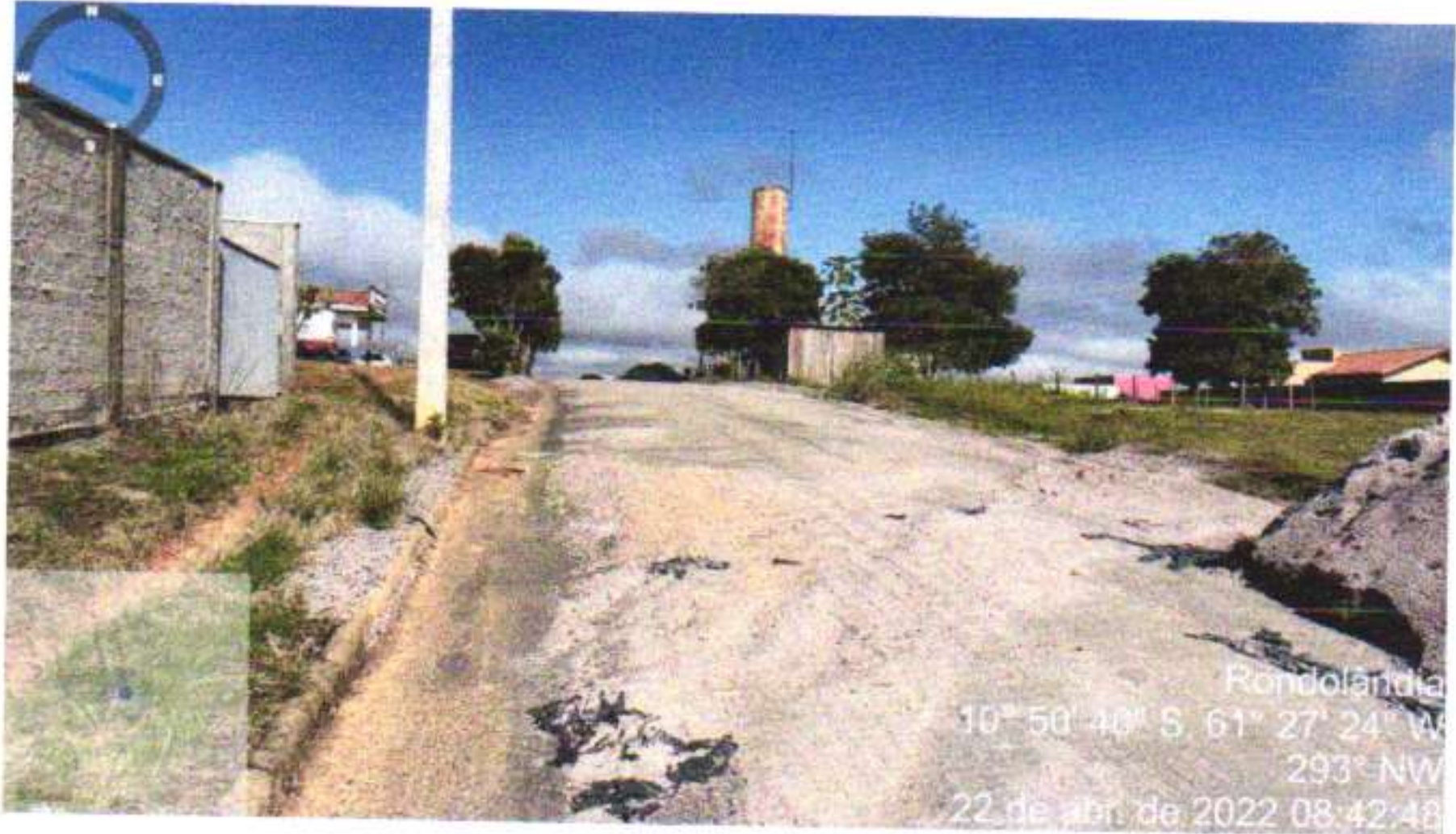
10 – RUA JOSÉ RAIMUNDO DA SILVA TRECHO (AV JOANA ALVES DE OLIVEIRA / RUA RIO MADEIRA)