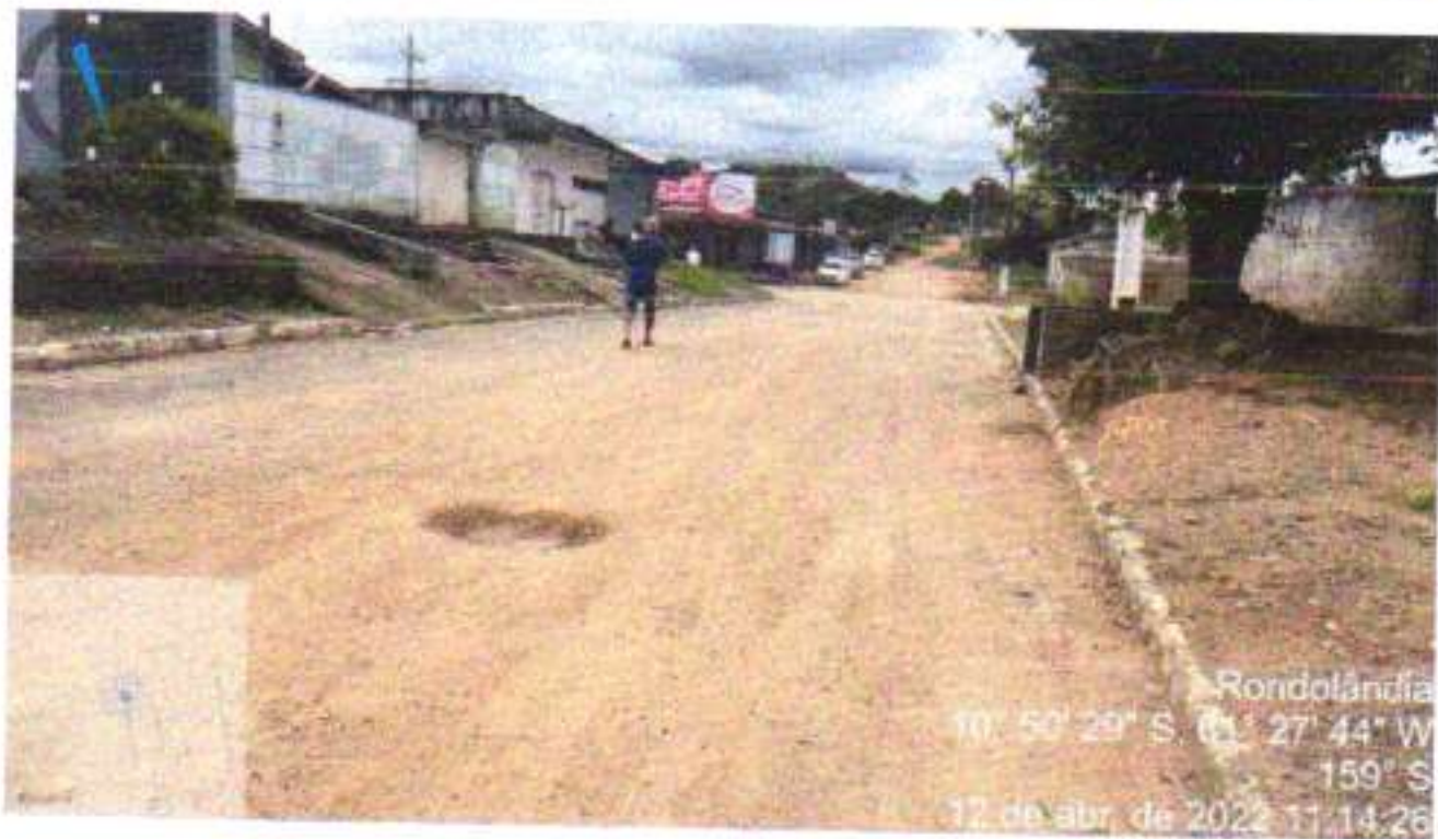
05 – AV ANDRÉ MAGGI TRECHO (RUA JAIME FREIRE / AV DOM BOSCO)