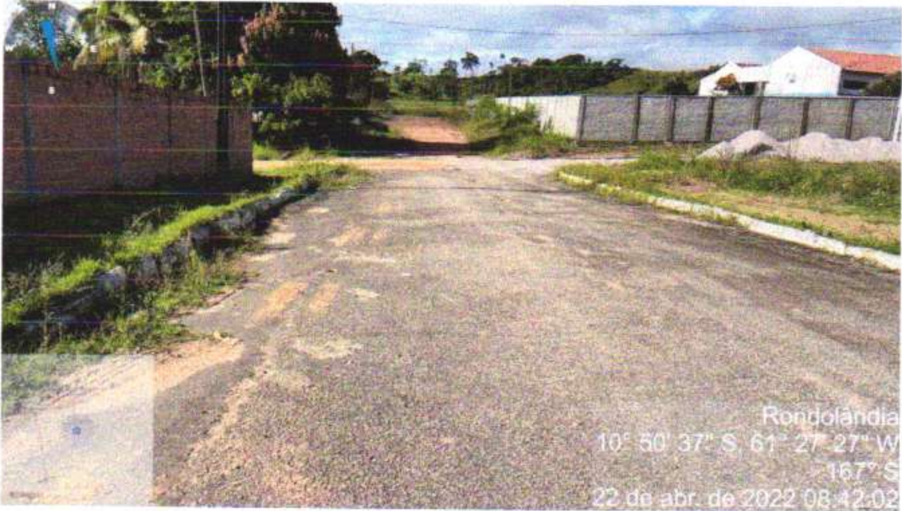
09 – RUA RIO MADEIRA TRECHO (RUA JOSÉ RAIMUNDO DA SILVA / RUA PEDRO MOREIRA)