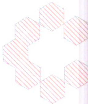
1 LOCAÇÃO DE SONDAGEM SPT ESCALA: 1/200