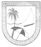
IMAGEM DO CADASTRO MERCANTIL