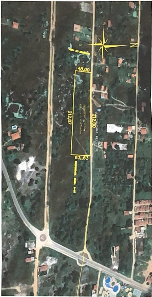
PLANTA DE LOCALIZAÇÃO DO GOOGLE SEM ESCALA