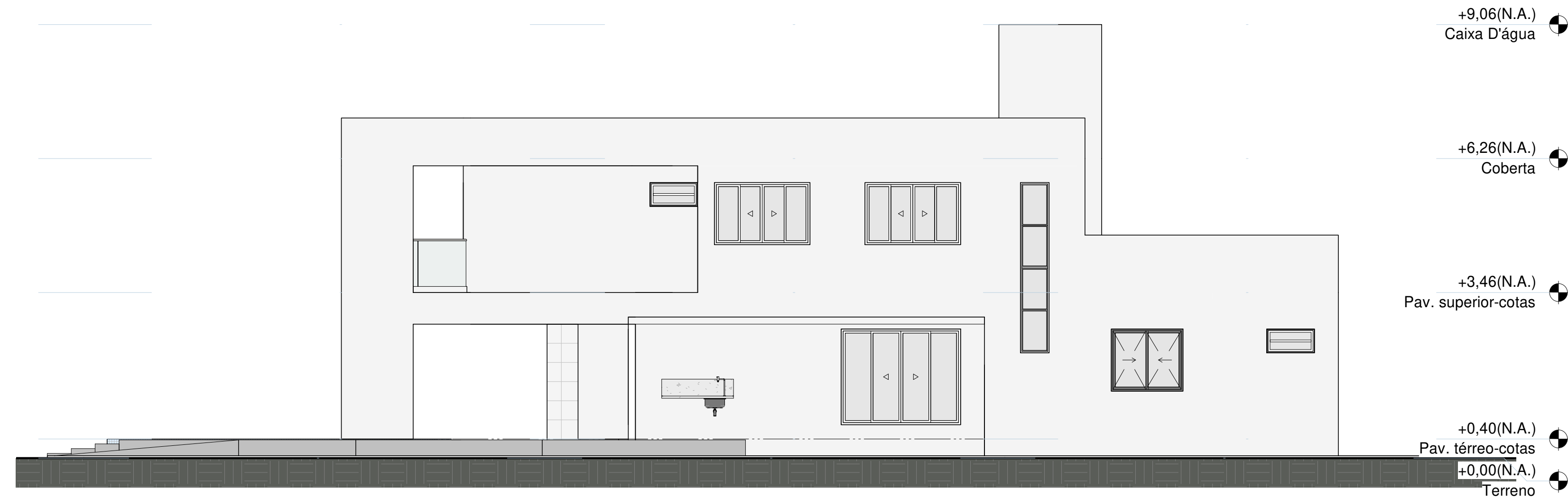
3 Fachada Nordeste 1 : 75