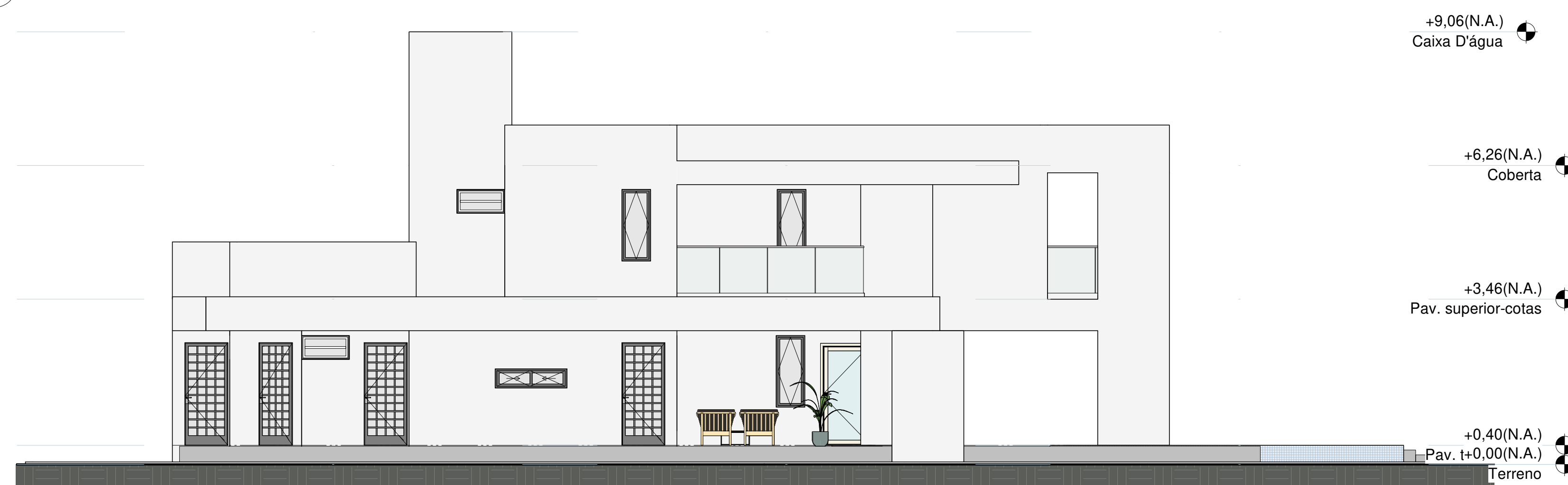
1 Fachada Sudoeste 1 : 75