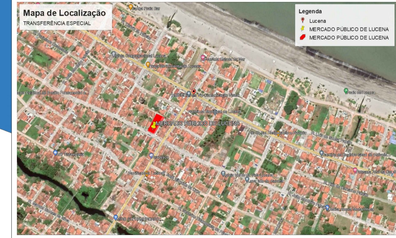
Mapa de Localização ESCALA 1/6000