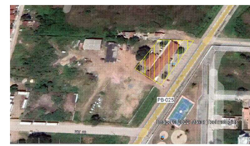
PLANTA LOCALIZACAO SEM ESCALA