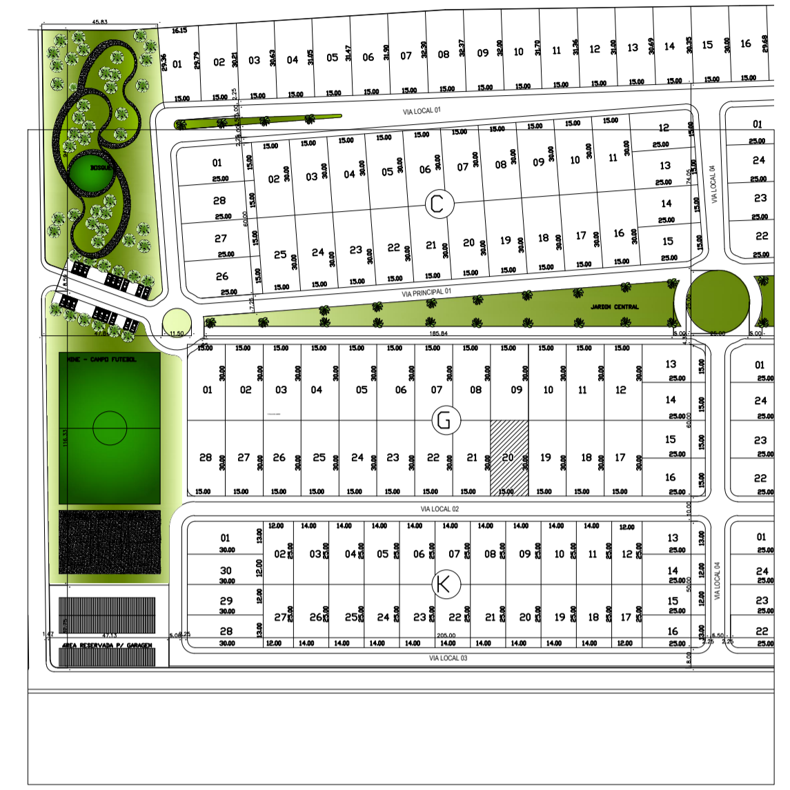
8 LOCALIZAÇÃO RESIDÊNCIA ESCALA: 1/1000

INS. NO CADASTRO IMOBILIARIO 01 02 03 04 05 06 07 08 09 10 11 12 13 14 15 16 17 18 19 20 21 22 23 24 25 26 27 28 29 30 31 32 33 34 35 36 37 38 39 40 41 42 43 44 45 46 47 48 49 50 51 52 53 54 55 56 57 58 59 60 61 62 63 64 65 66 67 68 69 70 71 72 73 74 75 76 77 78 79 80 81 82 83 84 85 86 87 88 89 90 91 92 93 94 95 96 97 98 99 100