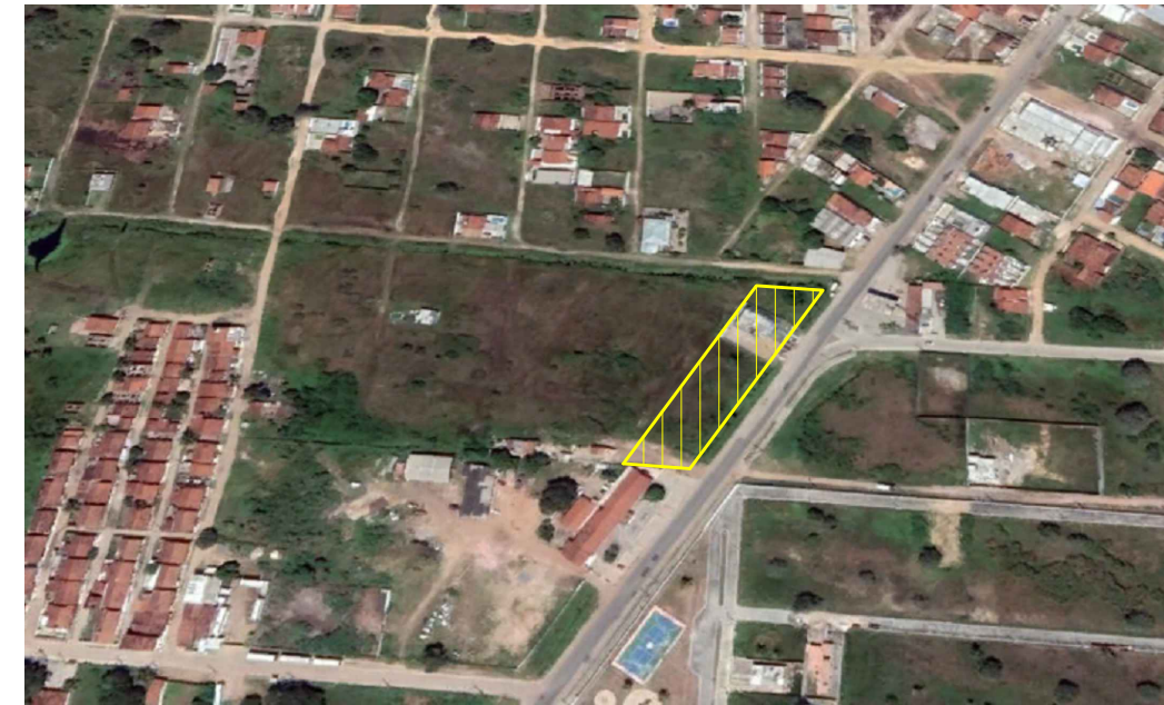
PLANTA DE LOCALIZAÇÃO DEM ESCALA