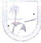
IMAGEM DO CADASTRO MERCANTIL